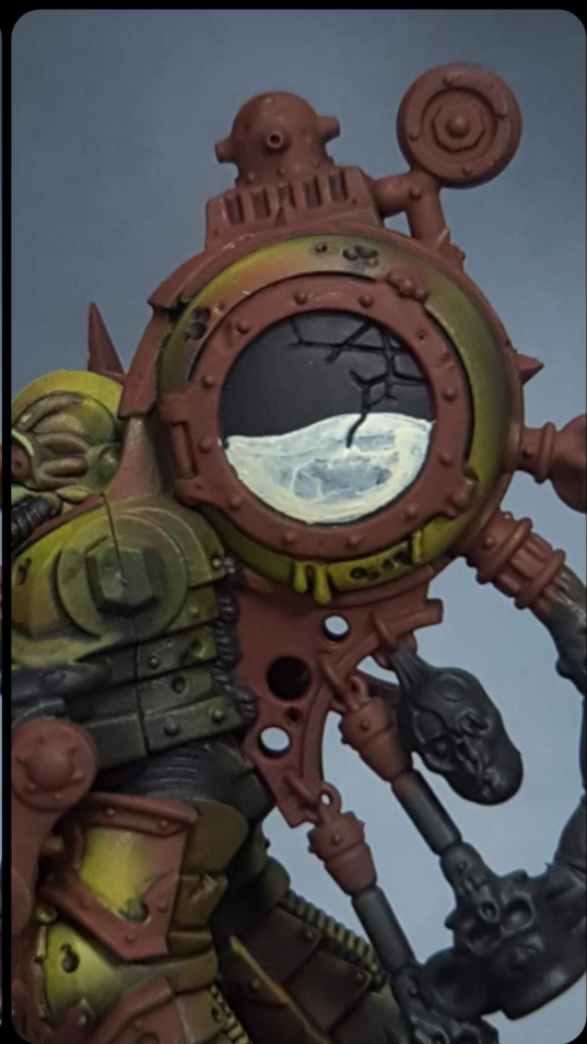
White/blanco Define the liquid level and shape Definir nivel y forma del liquido

I make the effect after paint the armor but before to do the metals. You can do the Cristal prior the armor but I dont recommend because will be masked during the process of the armor and the mask can fail