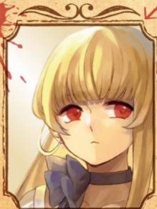
『緋の瞳』の持ち主 シュリア