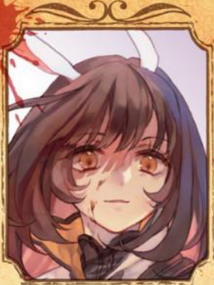
ウサギの獣人 ミナリス