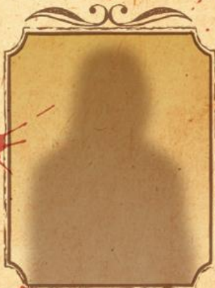
人族至上主義の村娘 ルーシャ