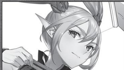
Lycia Mercedes (Archer)

One of the long-lived elves. Especially interested in Noel.