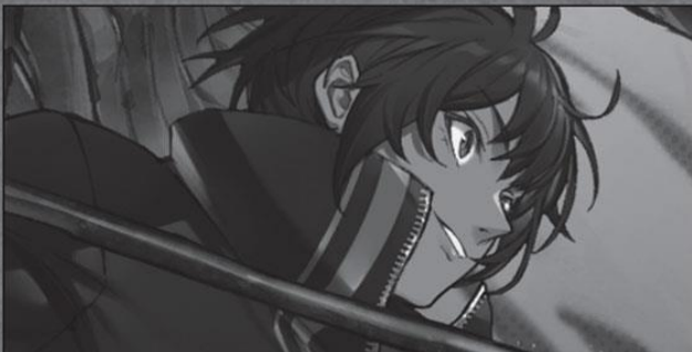
Zero Lindrake (Dark Knight)

Master of Lorelai. Scheming to take the lead role in the battle against the Valiant.